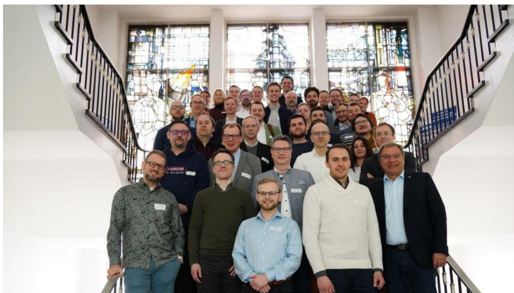
Abb. 2: Die knapp 40 Teilnehmenden des Workshops zu Kommunikationsprotokollen und Datenstandards

Einen Tag nach der feierlichen Eröffnung des FutureLab.NRW startete bereits der erste Workshop mit knapp 40 Teilnehmenden aus Industrie und Wissenschaft. Im Rahmen des Workshops wurden Lösungsansätze diskutiert, um die Anforderungen der Anwendergemeinde zu bündeln. Konkret ging es um die Frage nach den herstellerübergreifenden Schnittstellen und Datenformaten wie LADS OPC UA als Beispiel für ein nicht proprietäres Kommunikationsprotokoll für die Vernetzung von Hardware und Software als auch AnIML und Allotrope als Beispiele für nicht-proprietäre Datenstandards.