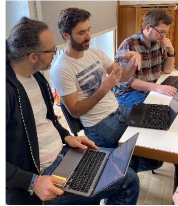
Abb. 3 + 4: 6. LADS OPC UA Hackathon am IUTA in Kooperation mit der Firma Gerstel