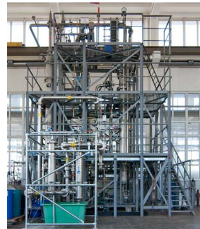
Druckgaswäsche / Absorption (Technikum)