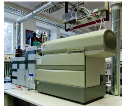
HPLC-MS/MS (Q Trap) zur Spurenanalytik Charakterisierung