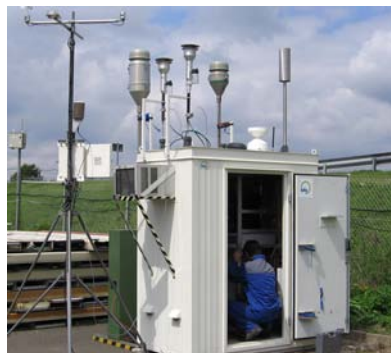
Messcontainer für Luftqualitätsmessungen

freuen sich über entsprechende Anfragen.